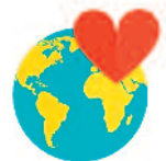
des œuvres humanitaires

Des actions d'Églises peuvent aussi comprendre des cours de français pour les étrangers, du soutien scolaire aux enfants en difficulté, l'accompagnement de personnes âgées et/ou en situation de handicap, des cafés solidaires, la promotion de l'économie du partage grâce au numérique, la plantation d'un verger en accès libre, etc.