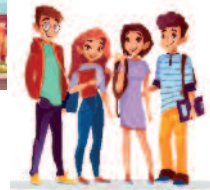
des associations d'étudiants