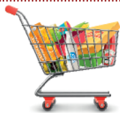
des épiceries solidaires

Le Réseau Nouvelles Connexions ancre sa vision « dans la mission intégrale, dans un esprit de service pour l'Église et pour la société ». Ses membres, Églises et œuvres, partagent la conviction que « l'Évangile est une puissance de transformation pour l'individu comme pour la société. L'Église, en tant que communauté du Royaume, est appelée à manifester la présence et le règne de Dieu à travers sa vie, son ministère ainsi qu'à travers l'engagement citoyen de chacun de ses membres » ( www.reseaucn.fr ). Ainsi ce réseau inclut :